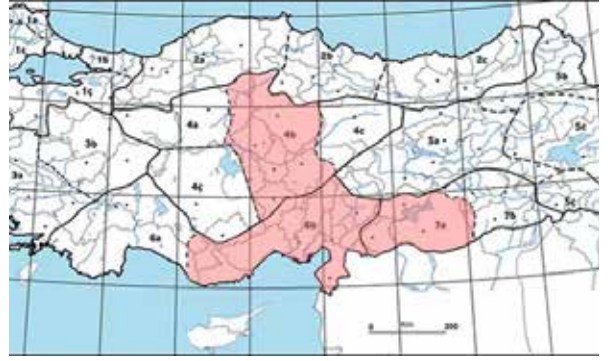
Şekil 1. Çemen bitkisinin ülkemizdeki yayılışı (1a) Istanca Bölümü, (1b) Çatalca-Kocaeli Bölümü, (2b) Orta Karadeniz Bölümü, (5b) Erzurum-Kars Bölümü, (6b) Adana Bölümü, (7a) Orta Fırat Bölümü, (7b) Dicle Bölümü

Çemen tohumunun tedavi edici özelliği, genellikle içerdiği steroidal saponinlerden kaynaklanır. Tohumların embriyosunda bulunan diosgenin adı verilen saponozitin varlığının saptanması sonucu bitkinin Avrupa, Amerika ve Doğu Afrika'da kültürü yaygınlaşmaya başlanmıştır.