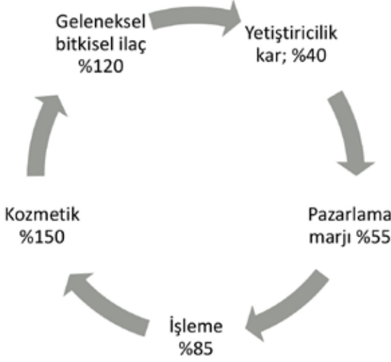
Şekil 2. Çemen Katma Değer Döngüsü